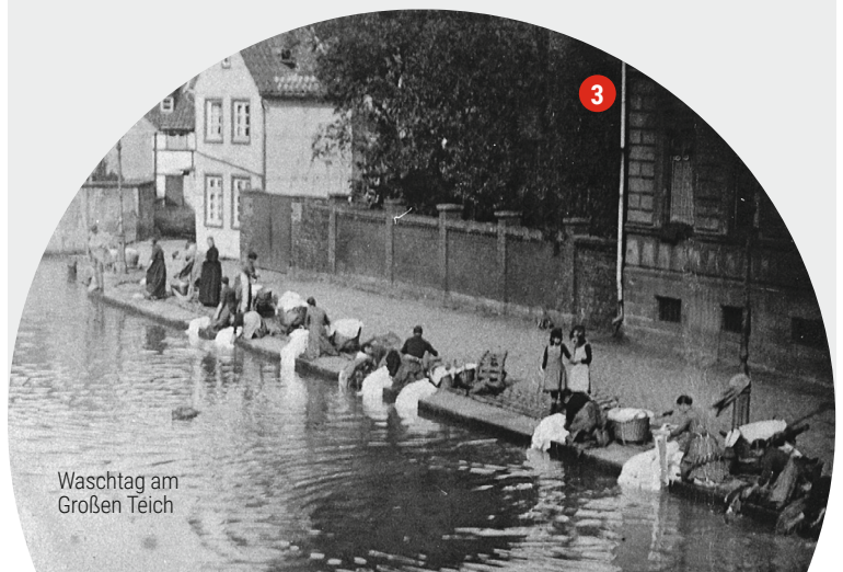
Waschtage am Großen Teich